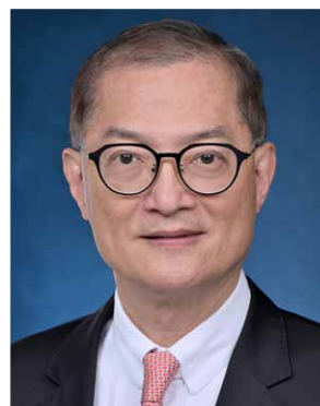
盧寵茂教授, BBS, JP 醫務衛生局局長